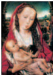
Εξώφυλλο: Η Βρεφοκρατούσα Παναγιά Hans Memling (1433-1494)

Και δώσε μου δύναμη για να ξέρω να ζω με τις αδυναμίες μου, χωρίς ποτέ να χάνω το θάρρος μου και να εναποθέτω πάντοτε σ' εσένα την εμπιστοσύνη μου.