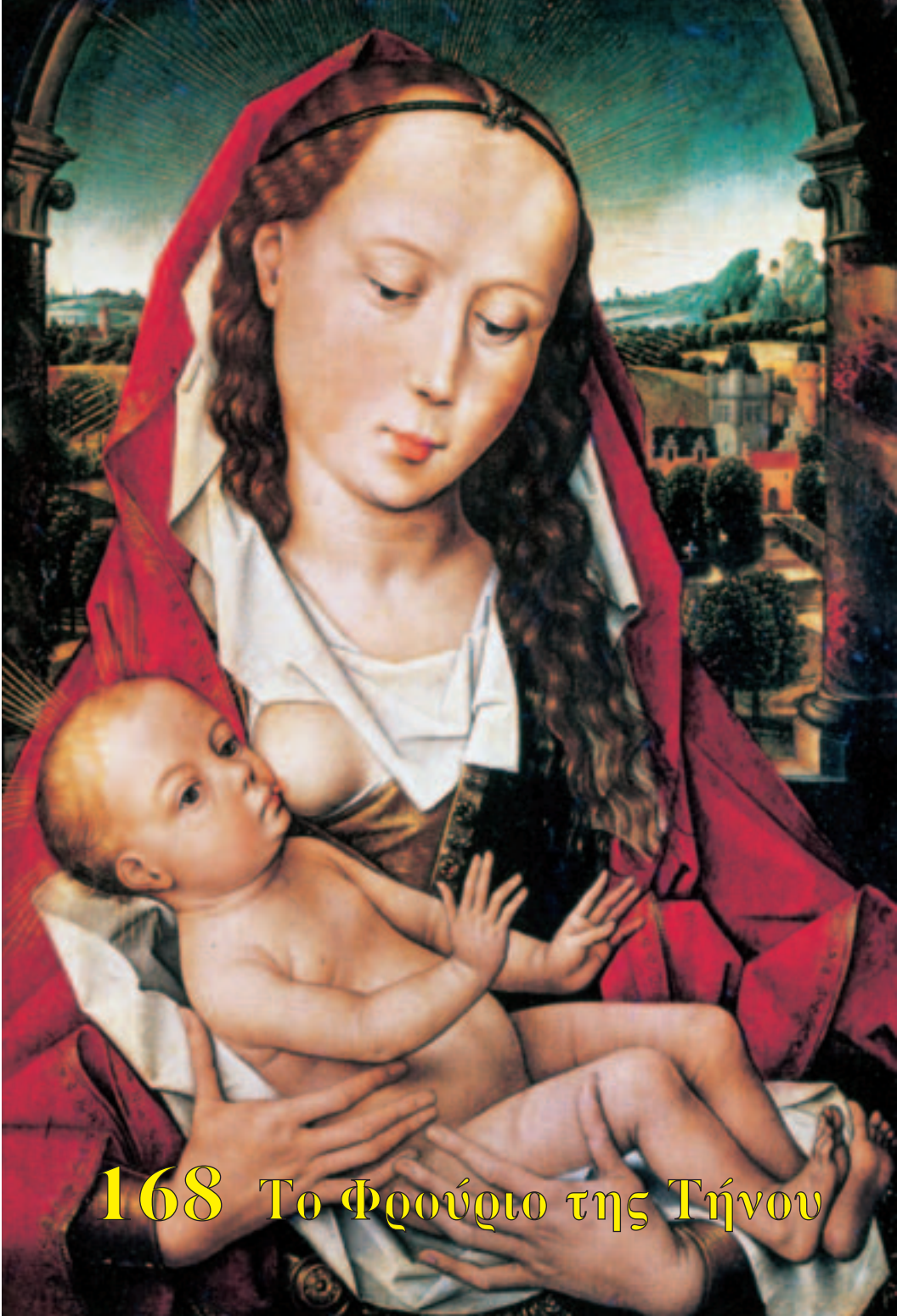
168 Το Φρούριο της Τήνου