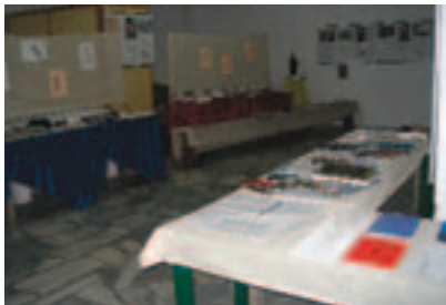
Έκθεση «Γνωριμία με τους Ιησουίτες»